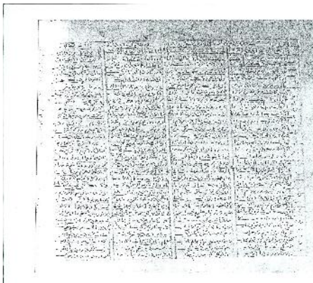
صفحه نخستین نسخه خطی از رباعیات مجد همگر کتابت ۶۹۷ هجری