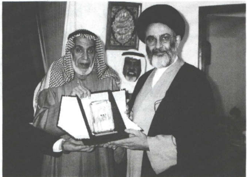
اهدای نشان هیئت عالی تطبیق شریعت به متولی کتابخانه

۳۶. الوسیط، ج ۲، از ابوحامد غزالی، کتابت ۵۷۵ ق، به خط نسخ قدیم، «ش ۵۷۵ م ک». ۳۷. الوسیط بین المقبوض و البسیط ۲ ، ج ۲، در تفسیر قرآن کریم، تألیف ابوالحسن علی بن احمد بن محمد بن علی واحدی نیشابوری شافعی، متوفی ۴۶۸ ق، کتابت ۵۸۱ ق، به خط نسخ عبدالله بن محمد بن عرفه الانصاری، «ش ۴۹۱ م ک». بعد از ظهر همان روز، ساعت ۵/۳۰، با همراهان برای بازدید از مجموعه هیئت مشورتی عالی تطبیق شریعت، عازم آن مرکز شدیم. وظیفه این مرکز تا حدودی شبیه وظایف شورای نگهبان در ایران است. هر قانونی که تصویب می‌شود، این مرکز آن را با قوانین اسلامی تطبیق می‌دهد؛ چنانچه قانونی مخالف اسلام باشد، قابل اجرا نخواهد بود. ریاست عالی این هیئت با دکتر خالد مذکور عبدالله المذكور است. شخصیت‌های برجسته مذهبی و علمی نیز با او همکاری دارند. دربدو ورود، مورد استقبال رئیس این مرکز قرار گرفتیم. آن‌گاه ما را با قسمت‌های مختلف آشنا کرد. این مرکز دارای کتابخانه بزرگ تخصصی است که ۲۵۰۰۰ عنوان کتاب را در خود جای داده، و بیشتر انتشارات کتابخانه آیت‌الله مرعشی، به‌ویژه مجموعه فهارس نسخه‌های خطی آن