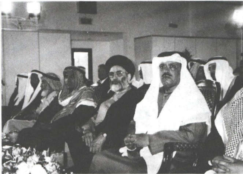
مراسم افتتاح نمایشگاه بین‌المللی کتاب کویت