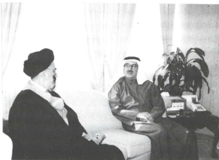
دکتر بدر الرفاعی، دبیر کل مجلس ملی فرهنگ و هنر و ادبیات کویت

ایشان، همچنین آقای حبیب لمسی، مدیر و بنیانگذار انتشارات دار الغرب الاسلامی در بیروت، که اصلاً از مردم تونس و از موفق‌ترین ناشران عرب به‌شمار می‌رود، حضور داشتند. وی کتابخانه شخصی خود را که بالغ بر ۷۵ هزار جلد بسیار نفیس داشت، وقف کتابخانه ملی تونس کرده است. ایشان هر کتاب مهمی را که بیابد، برای کتابخانه تونس ارسال می‌کند و بر مجموعه اهدایی خود می‌افزاید. پس از صرف شام، به محل