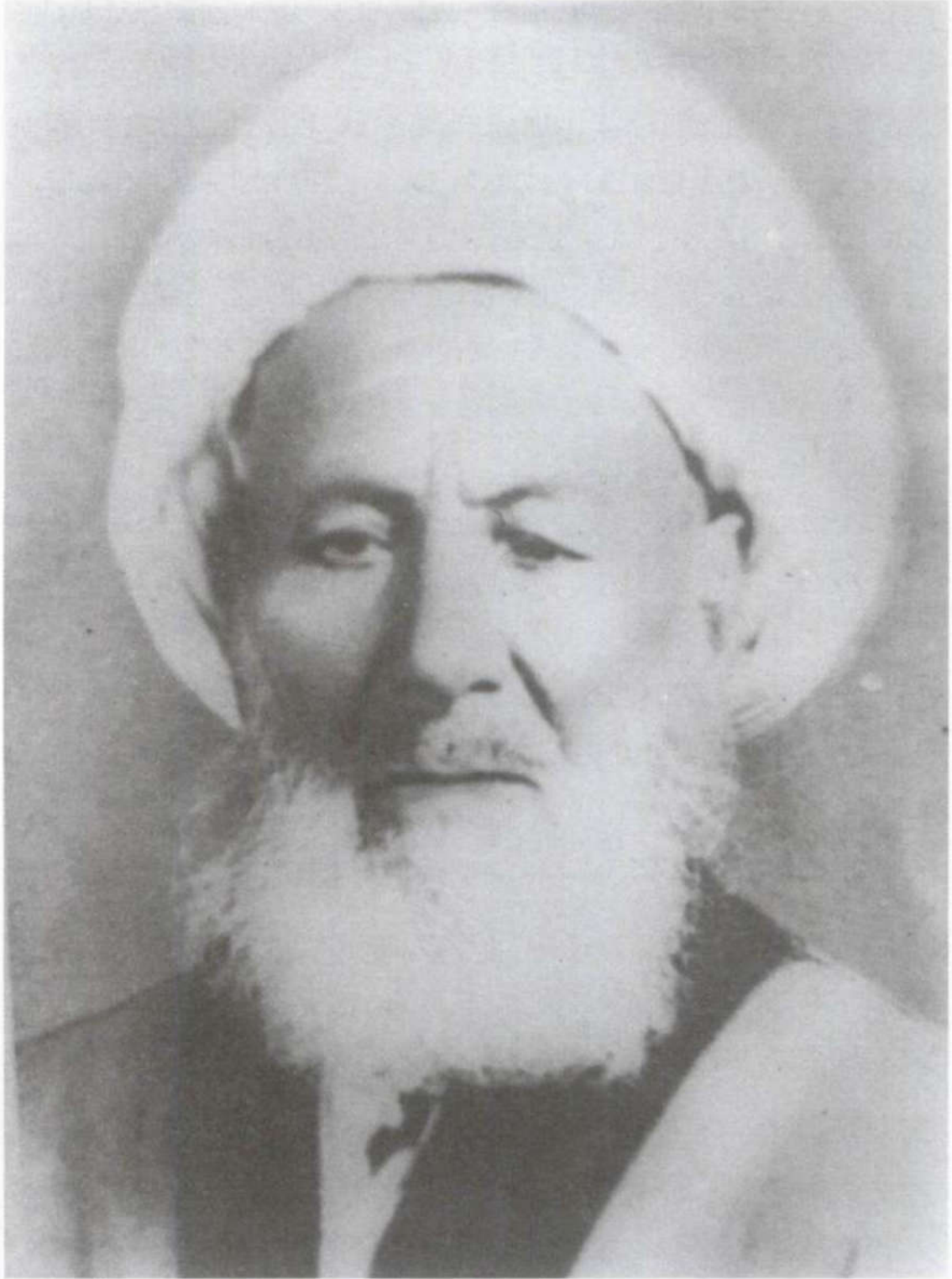
تصویر آیت الله شیخ محمد سنگلیگی قوچانی