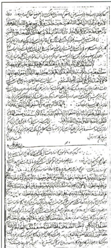
جواهر القرآن = خواص القرآن، نسخه شماره ۳۰۰/۴