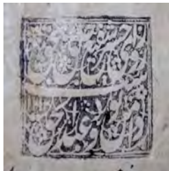
۲۹- نقش مُهر مورد پرسش استاد عارف نوشاهی سجع به خط نستعلیق: روز حشر ای شفیع خلق بحق / دامن تو و دست عبدالحق