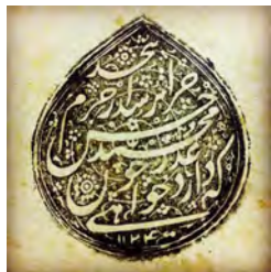
۳۱- نقش مُهر ارسالی سجع به خط نستعلیق: که دارد عذرخواهی چون محمد / چرا ترسد حَسَن از جرم بیحد، ۱۱۲۴