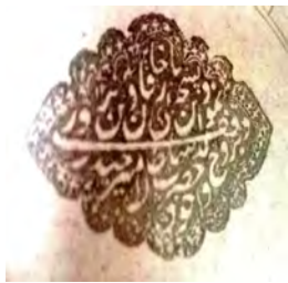
۲۸- نقش مُهر مورد پرسش استاد عارف نوشاهی، سجع به خط نستعلیق: نمود این نسخه وقف بی ریا خاقان دین پرور / بروح والد خود حضرت سلطان امیر حیدر