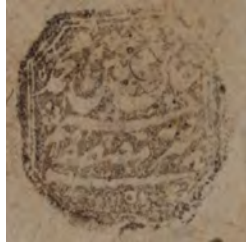
۲۷- نقش مُهر ص ۴ ش ۷۴، به شکل هشت گوش و خط نستعلیق: «خاک نعلین محمد سرمه چشم مصطفی»