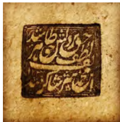
۳۰- نقش مُهر ارسالی از یکی از علاقه مندان سجع به خط نستعلیق: لطف حق بر دلش ظاهر شد / ابن محمد شریف شاکر شد، ۱۲۳۰